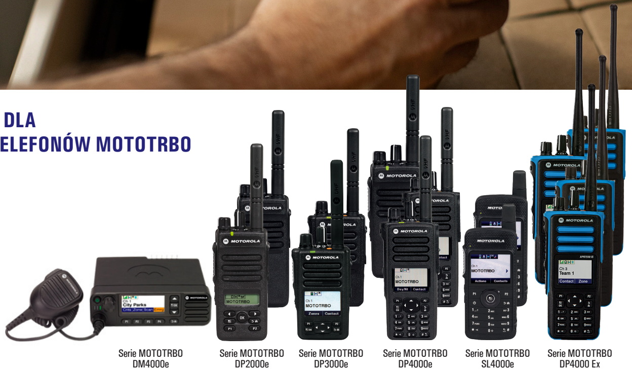
Serie MOTOTRBO DM4000e